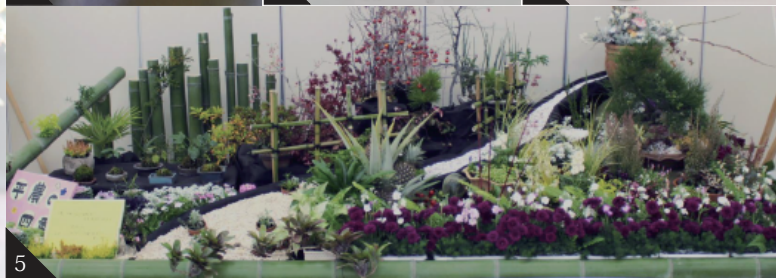
1. ハングングバスケット展示 2. おしぼな展示 3. ビクトリーブーケ展示 4. 生け花展示 5. フラワーディスプレイ展示